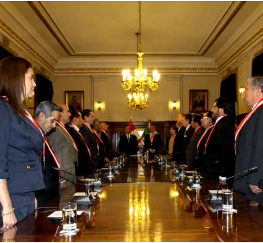
Presidente mexicano Felipe Calderón Hinojosa fue recibido en Sala Plena de la Corte Suprema.