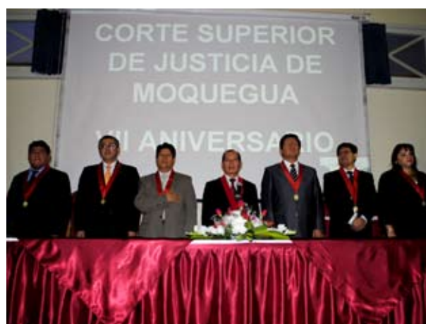
Presidente de la Corte de Moquegua acompañado de Jueces Superiores

Durante la ceremonia se realizó un reconocimiento a la Sala Penal de Apelaciones, el Segundo Juzgado de Paz Letrado de Ilo y el Juzgado de Familia de Ilo, quienes sobresalieron en el ranking a nivel Nacional.