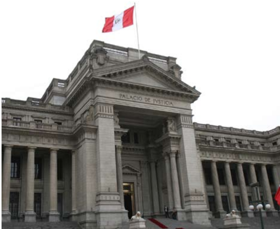
Frontis del Palacio Nacional de Justicia.

La LPT consagra los principios de inmediación procesal, oralidad, concentración, celeridad, economía y veracidad, razón por la cual los juicios de esta materia serán más rápidos y transparentes.