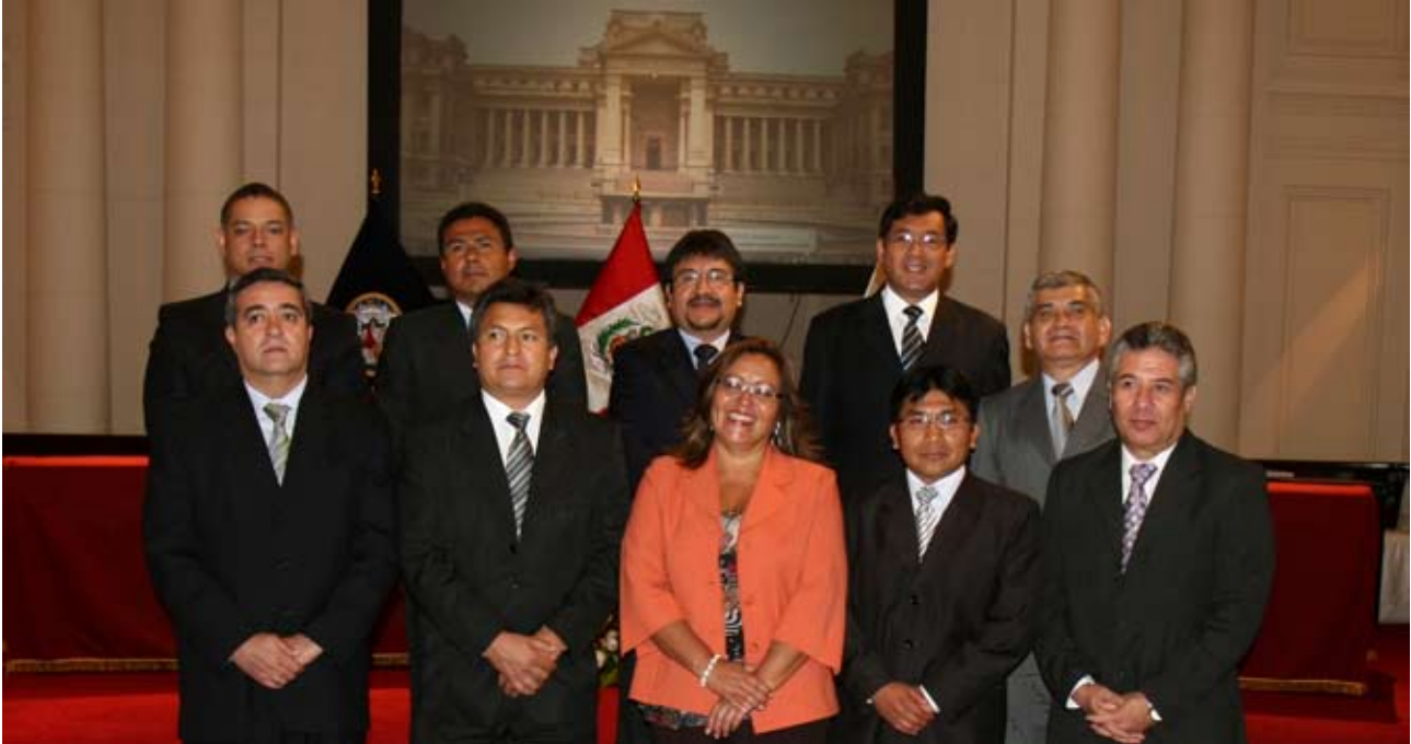
Gerentes públicos fueron designados luego de un riguroso proceso de selección.