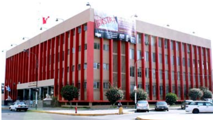
Fachada de la Corte Superior del Callao.