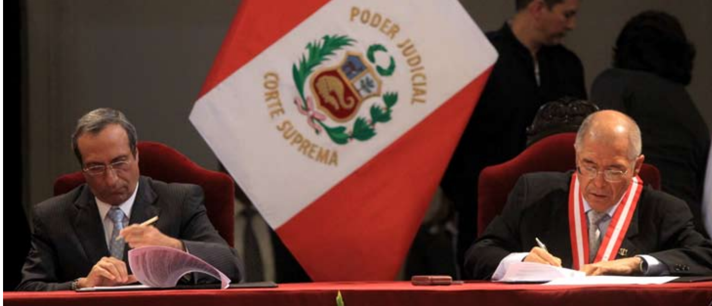
Acuerdo busca combatir el flagelo de la corrupción.

SUSCRIBIERON PODER JUDICIAL Y CONTRALORÍA