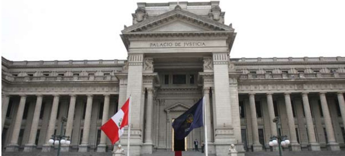
Frontis del Palacio Nacional de Justicia.