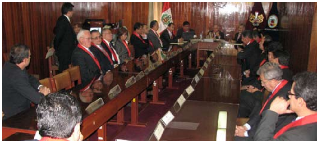
La sesión de Sala Plena fue muy productiva.

Explicó que todas estas medidas buscan que las Cortes Superiores tengan una autonomía más firme para que asuman sus respon-