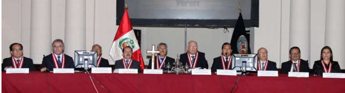
Supremo Tribunal adoptó importante decisión.

SOBRE DIVORCIO POR CAUSAL DE SEPARACIÓN DE HECHO