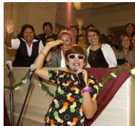
Homenaje por el día de Mamá se vivió con mucha alegría.