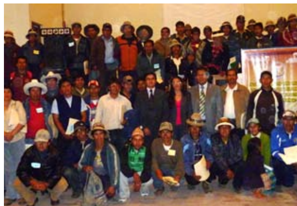
Magistrados y asistentes del Taller de Operadores de Justicia Local de Cotabambas