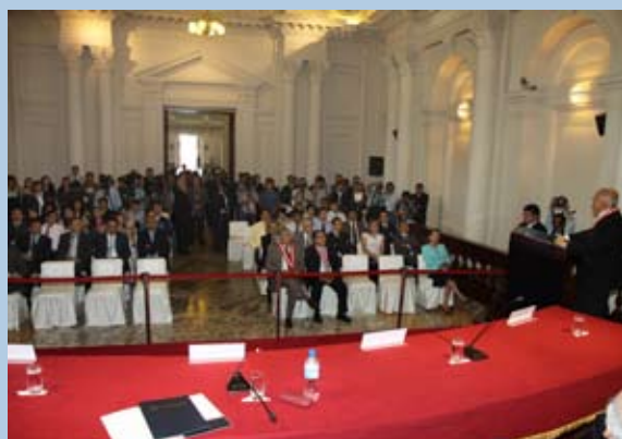
Presentación de nuevo sistema generó expectativa.

Garantizó la transparencia con este moderno sistema porque las causas serán distribuidas de manera aleatoria y la designación de los Jueces ponentes se efectuará utilizando un software especialmente diseñado, que impide “la intervención de