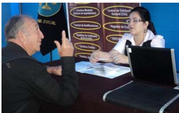
Campaña informativa para acceso a la justicia.